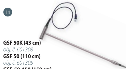
GSF 50K (43 cm) obj. č. 601308