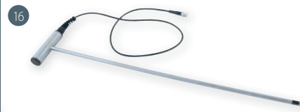
GSF 40 (67 cm) obj. č. 601316