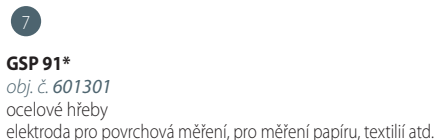
GSP 91* obj. č. 601301 ocelové hřeby elektroda pro povrchová měření, pro měření papíru, textilií atd.