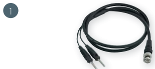
GMK 38 obj. č. 601261 měřicí kabel s konektory BNC a 2x banánek, ~90 cm dlouhý