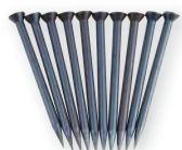
GST 91/40 obj. č. 601275 ocelové hřeby 10 ocelových hřebů v plast. dóze, Ø 2,5 mm, délka 40 mm